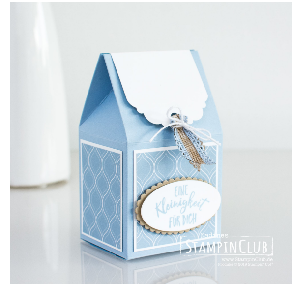
Lasche: Farbkarton 5,1 cm x 7 cm