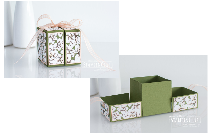
Farbkarton 21 cm x 28 cm