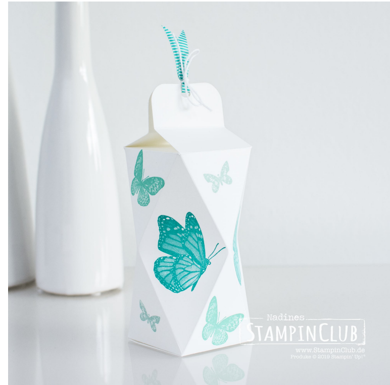
Farbkarton 21 cm x 21 cm